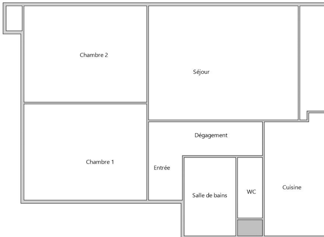
Planche (croquis) de repérage technique effectué par le cabinet : ALLODIAGNOSTIC , auteur : Dossier n° 811353 du 03/10/2016 Adresse du bien : 31 RUE HENRI GUILLAUMET 478 47803B4314 77400 LAGNY SUR MARNE